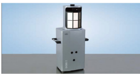
遥感遥测成像红外光谱仪SIGIS2 深圳深志环境科技有限公司