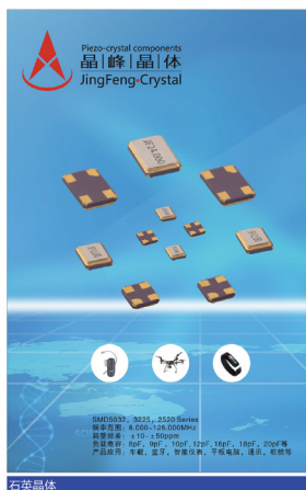
石英晶体 深圳市晶峰晶体科技有限公司

着重展现 5G 应用场景、数字孪生、边缘计算、工业互联网、物联网等与新基建相关的新产品新技术，以及以新一代信息技术为核心的新网络、新设施、新平台以及新终端，数字经济等新经济相关的新技术。