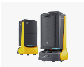
闪电楼宇配送机器人 深圳市普渡科技有限公司