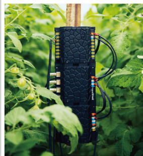
AquaShield监控系统 匈牙利 AquaShield Control Kft.