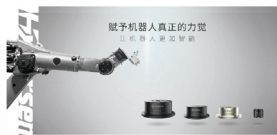
六维力传感器 海伯森技术（深圳）有限公司