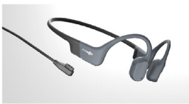
AEROPEX骨传导蓝牙耳机 深圳市韶音科技有限公司