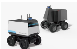
KST智能消杀防疫机器人 万助科技（深圳）有限公司（天使母基金展团）