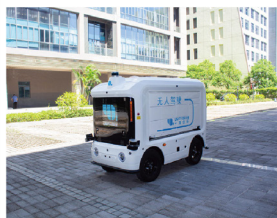
一清夸父多功能无人车 深圳一清创新科技有限公司

围绕“十三五”规划成果、“十四五”规划布局和重点发展领域，集中展示高端装备等战略性新兴产业，着重展示智能装备、智能工厂、智能社区、智能交通、工业机器人、3D打印、激光产品、个性化定制、智能制造、工业互联网等领域的企业。