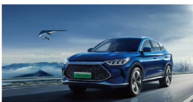
比亚迪秦Plus、宋Plus超级混动车型等新能源车型 比亚迪汽车有限公司

积极响应“碳达峰、碳中和”号召，集中展示体现环保和能源产业的发展趋势以及服务于绿色生活、绿色发展的相关应用，重点展示核能、太阳能、氢能等新能源、智慧环保（物联网、云计算、大数据、移动互联网等信息化技术在生态环保建设和治理中的应用）、环保材料、储能、智慧电力、节能应用等领域的最新产品、技术及应用。